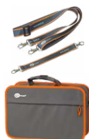
Szelki do miernika (typ L-2)