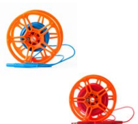
Przewód pomiarowy na szpuli do pomiaru uziemień 15 m / 30 m