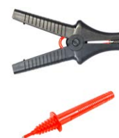
Krokodylek 11 kV 32 A czarny WAKROBL32K09