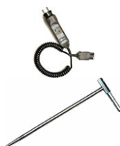
Przewód Uni-Schuko z wyzwaniem pomiaru (CAT III 300 V) WAADAWS03