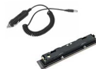
Przewód do ładowania akumulatora z gniazda samochodowego 12 V WAPRZLAD12SAM